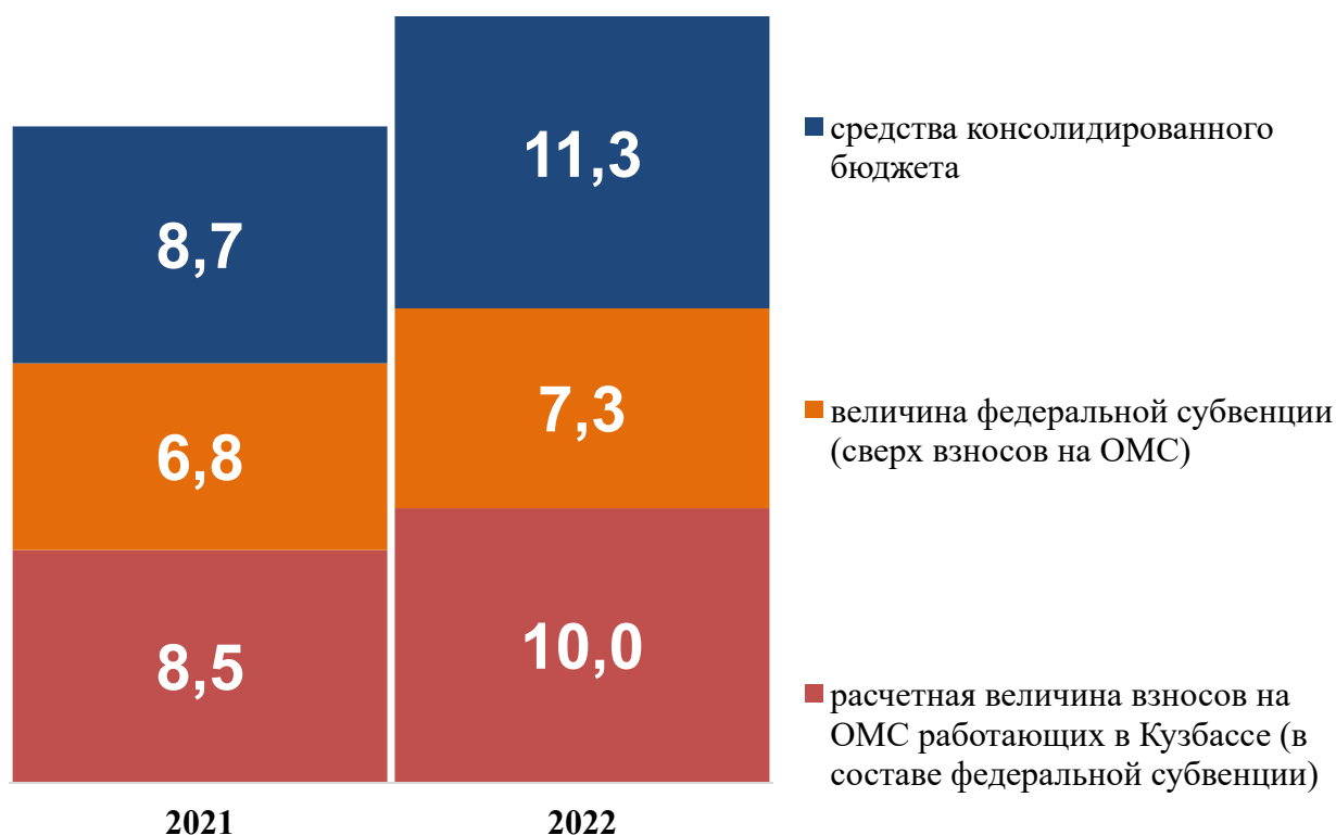
Фактические расходы консолидированного бюджета и бюджета ТФОМС

В течение 2022 года в структуре фактических расходов консолидированного бюджета и бюджета ТФОМС на душу населения в Кемеровской области – Кузбассе произошли следующие изменения (по сравнению с 2021 годом):