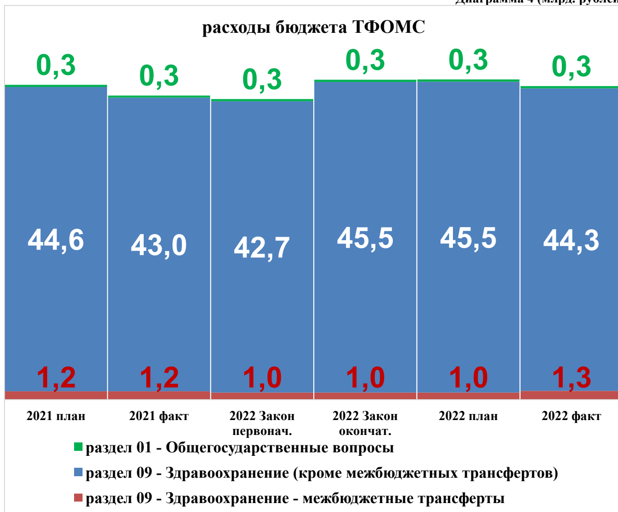
Диаграмма 4 (млрд. рублей)

Исходя из информации, отраженной в форме «0503317» за 2022 год, все расходы по разделу «09» делятся по трем направлениям расходов: